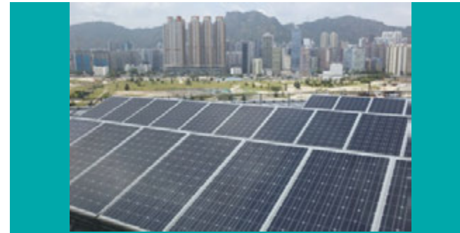
● Città a bassa emissione di carbonio