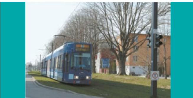
● Infrastrutture verdi