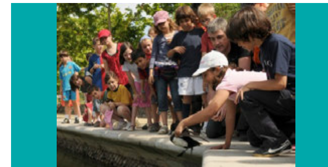
● Alta qualità della vita