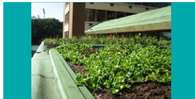
● Efficienza energetica