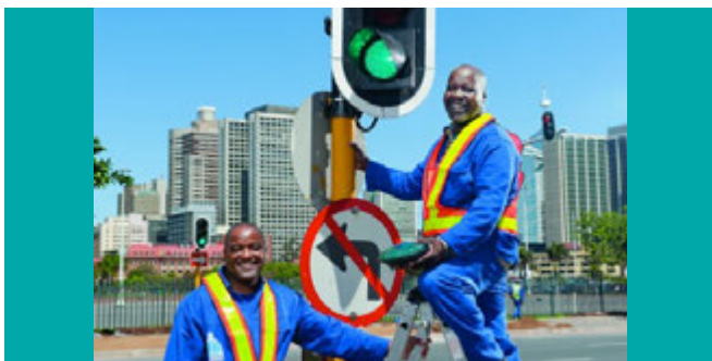
● Green economy